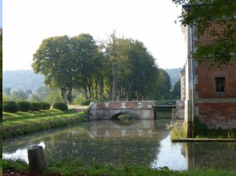
L'accès au château (allée d'arbre, pont)