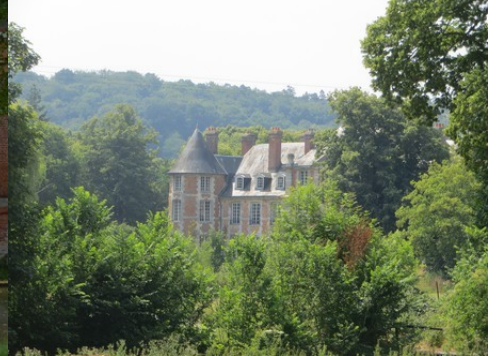
Le château depuis le clocher de l'église