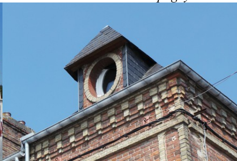
Une lucarne (détail)