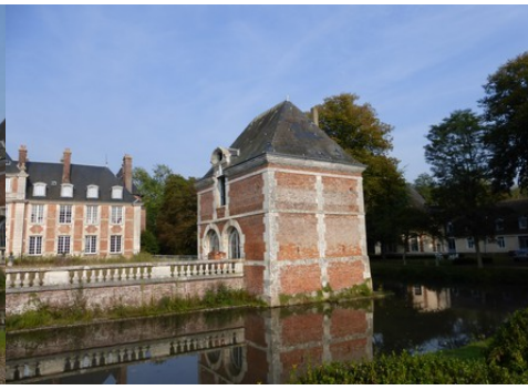
Le pavillon sud-ouest et les douves