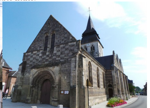
L'église de Serquigny