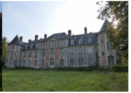
La façade est du château