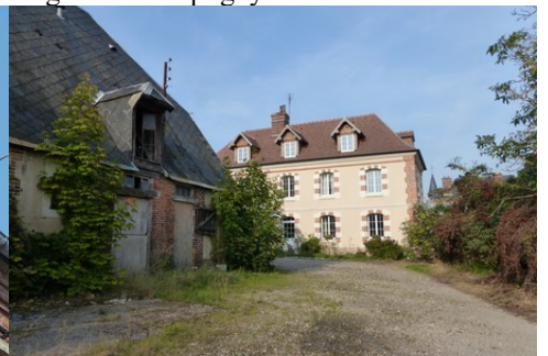
L'architecture rurale aux abords