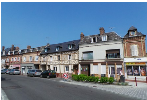
Des maisons en centre-ville