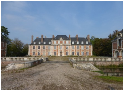
La façade sud du château