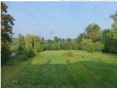
La vallée de la Charentonne

Les avis seront cohérents avec ceux émis ces dernières années, à savoir : pas de maisons à volume compliqué (type V, W, Y, ou Z), pentes à 45° pour les volumes principaux, ardoise ou tuile plate de teinte brun vieilli, à 20u/m 2 , avec un débord de toiture de 20cm, enduit de teinte beige clair avec modénatures (au choix : chaînages, encadrement de fenêtres, soubassement, colombage...). *Voir les autres fiches.