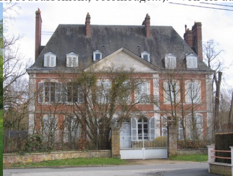
La demeure dite du Petit Serquigny