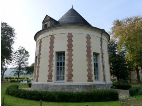
Le colombier transformé en gîte